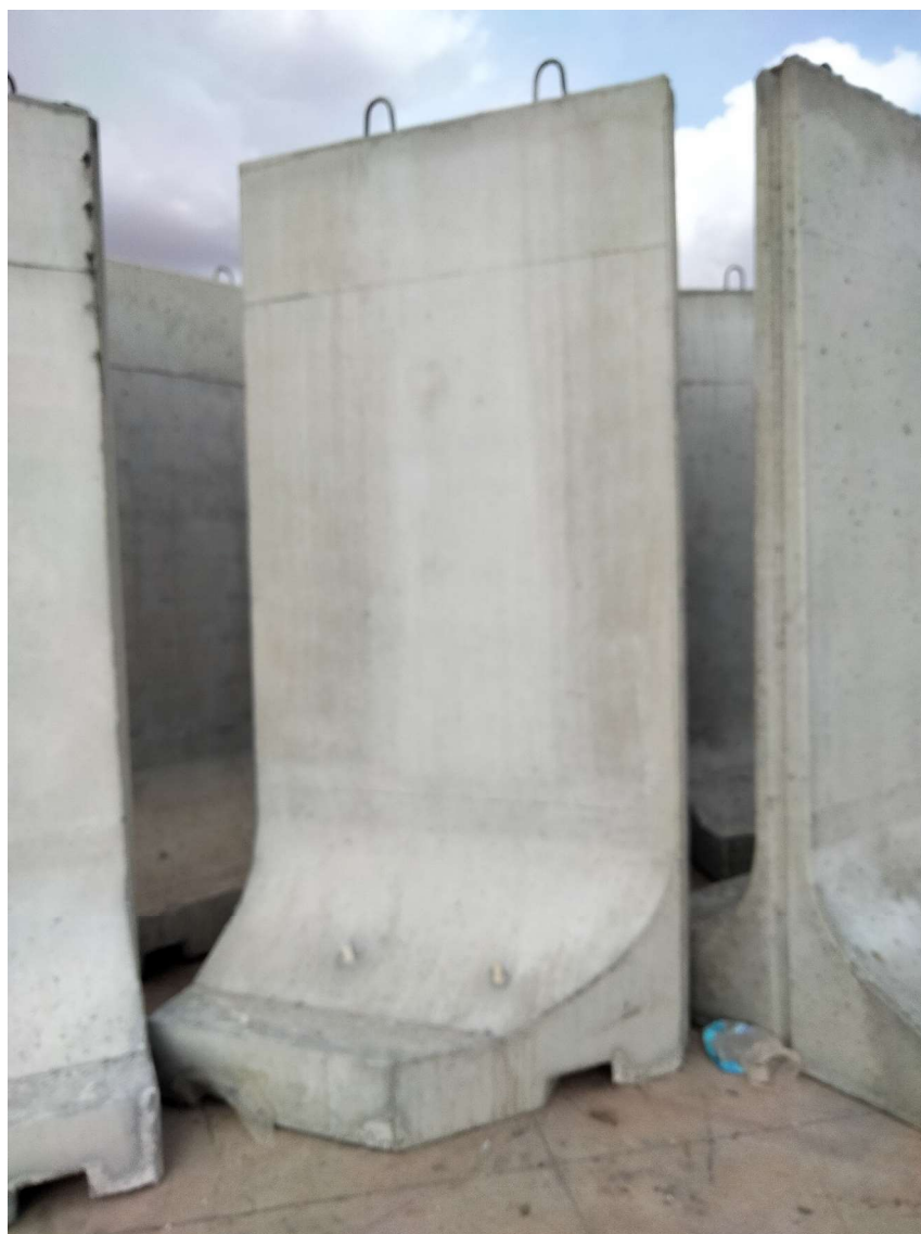
Imagen 3 . Separador de Esquina.

UNIÓN EUROPEA FONDO EUROPEO DE DESARROLLO REGIONAL UNA MANERA DE HACER EUROPA