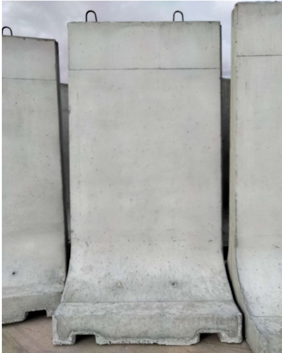
Imagen 1. Vista frontal separador.

Se adjuntan imagenes gráficas de los citados separadores.