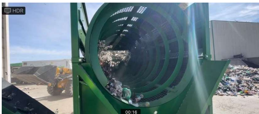
Imagen 3 . Detalle carga Criba Móvil.

Dirección General de Política Financiera, Tesorería y Fondos Comunitarios Consejería de Hacienda y Administraciones Públicas