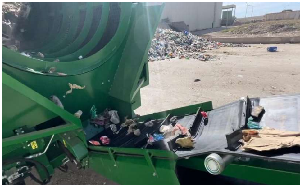
Imagen 2 . Detalle carga Criba Móvil.

UNIÓN EUROPEA FONDO EUROPEO DE DESARROLLO REGIONAL UNA MANERA DE HACER EUROPA